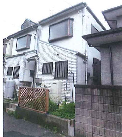
※図面と現況が異なる場合は現況優先となります。