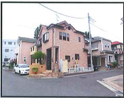
※図面と現況が異なる場合は現況優先となります。