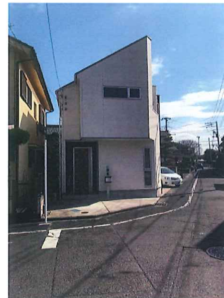
※図面と現況が異なる場合は現況優先となります。